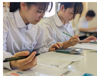
簿記論・財務諸表論

株式会社における取引の記録・計算・整理に関する知識と技術を身につけます。1級会計にチャレンジ！日商2級にstep up！